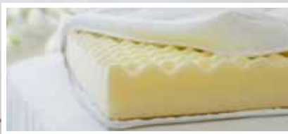
MADRAS BABY / JUNIOR