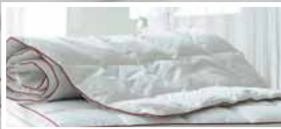
DUN RULLEMADRAS BABY / JUNIOR