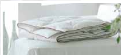
DUNDYNE EXTRA LET